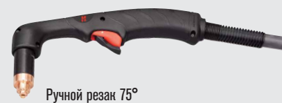
Ручной резак 75°

(дополнительные варианты резаков см. на веб-сайте www.hypertherm.com )