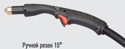
Ручной резак 15°