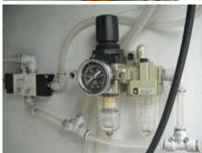
Блок подготовки воздуха