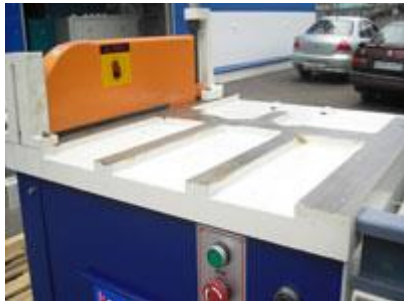
Надежную фиксацию заготовки обеспечивает прижим