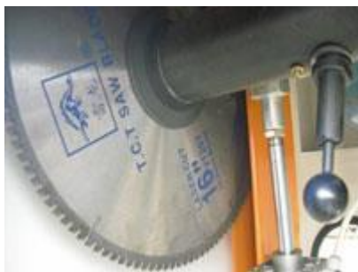
Стопор вала для замены пильных дисков