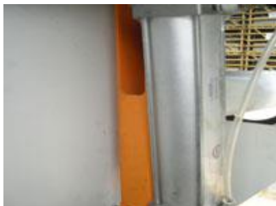
Подача пилы при помощи пневмоцилиндра

Адрес: 050061 РК, г. Алматы, мкр. Курылысши, ул. Кокорай д. 2а/1, Тел./факс: +7(727)344-08-98, моб: +7(705)554-04-24, e-mail: info@kazstanex.kz web: www.kazstanex.kz